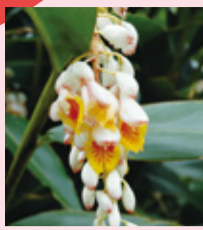
こちらが月桃。沖縄では古来より愛されているハーブです。