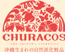
THE CHURACOS COMPANY 沖縄生まれの自然派化粧品