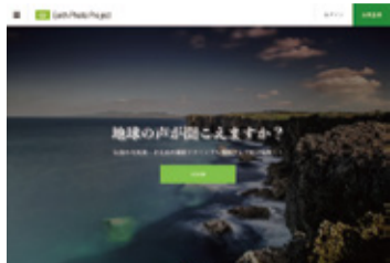
秋元さんの写真投稿サイト「Earth Photo Project」 http://sns.earth/