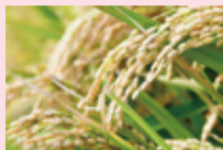
国産のお米から取れたもみ殻ケイ素を使用

ある自然素材に出会ったことがきっかけで、人と環境に優しい除菌剤の開発を思い立ったうえまでしたが、エビデンスが取れず心が折れかけた時も…。しかし、開発を諦めかけた時に再び出会えた「これだ——！」と思える理想の素材！